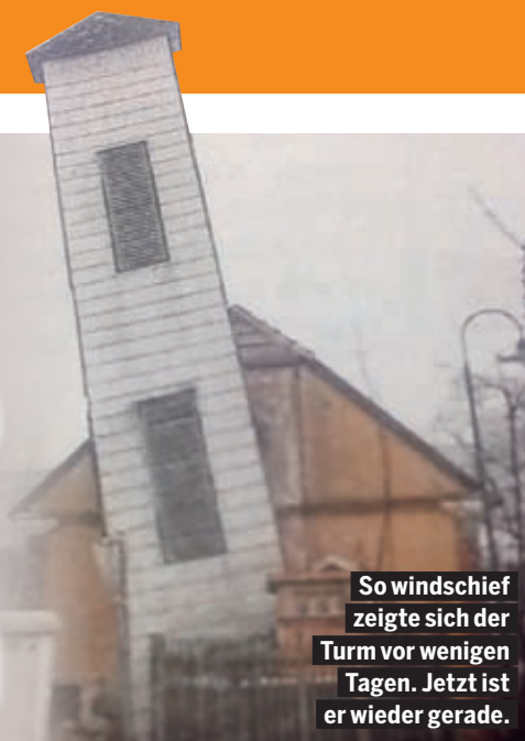
So windschief zeigte sich der Turm vor wenigen Tagen. Jetzt ist er wieder gerade.

Heftiger Sturm nahm altes Feuerwehrhaus übel mit