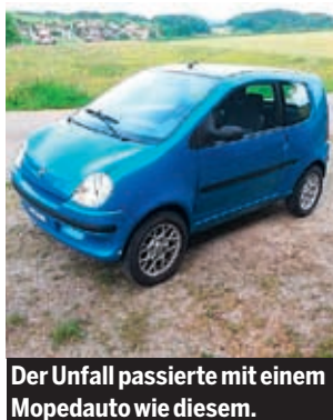
Der Unfall passierte mit einem Mopedauto wie diesem. (Symbolfoto)

der Stockerauer Straße „nichts“ bemerkt, nur einen „Anprall auf der Windschutzscheibe“ gespürt haben. Als er sein Gefährt danach stoppte, lagen die Senioren auf der Straße. Er und seine Beifahrerin (16) blieben unverletzt. (wef)